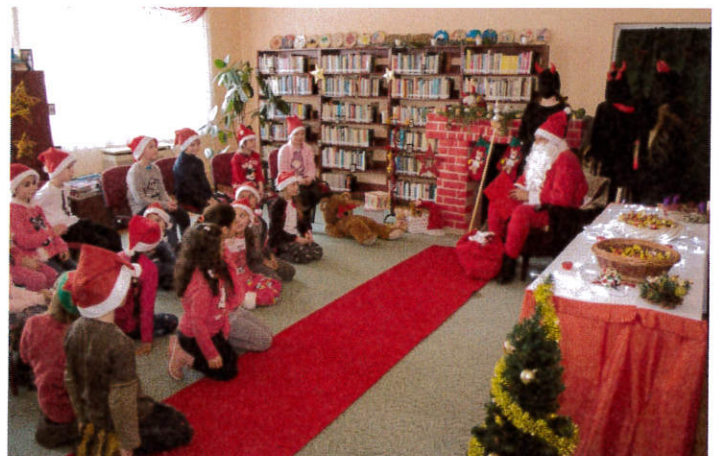
Mikulás a könyvtárban