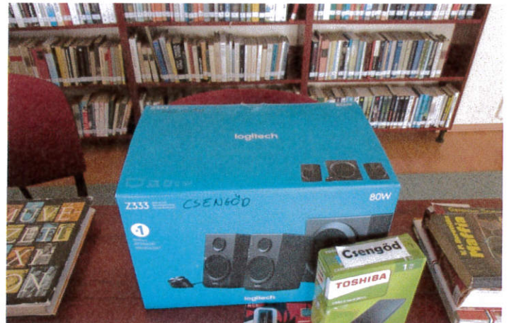
Új könyvek, irodaszerek, egyéb eszközök kiszállítása