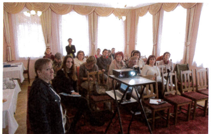
Szakmai nap, 2017. november 16.

Helyszín: Bács-Kiskun Megyei Katona József Könyvtár, Kecskemét