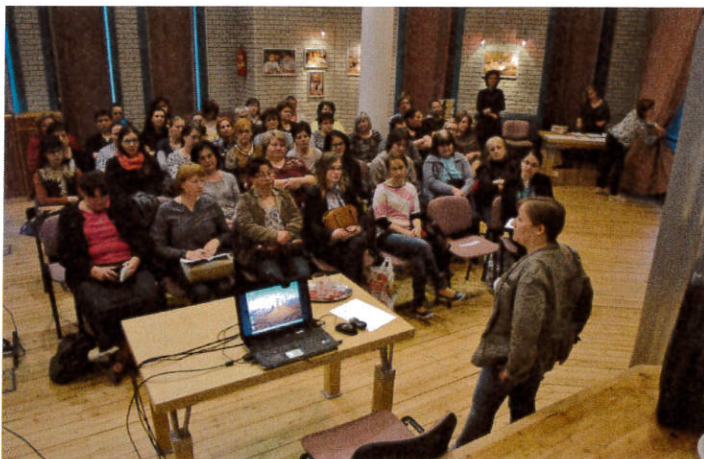
Szakmai nap, 2017. április 10.

Helyszín: Bács-Kiskun Megyei Katona József Könyvtár, Kecskemét